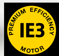
Abb.: SXC 8